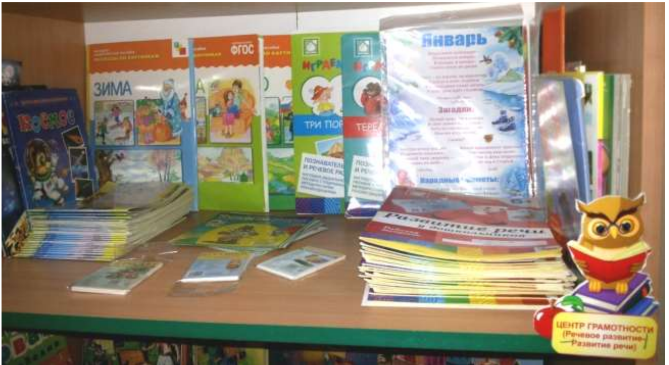
Дидактические материалы по сенсорике, ФЭМП, развитию речи, обучению грамоте, логике