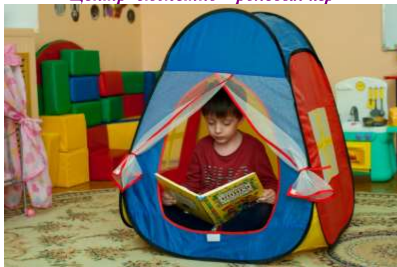
Место для уединения ребенка