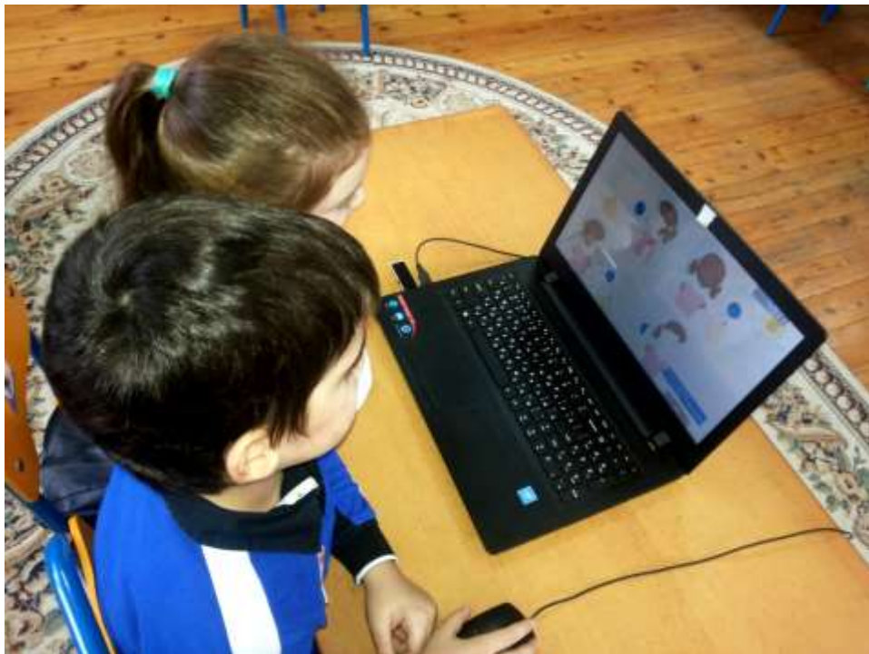
Использование ИКТехнологий в работе с детьми