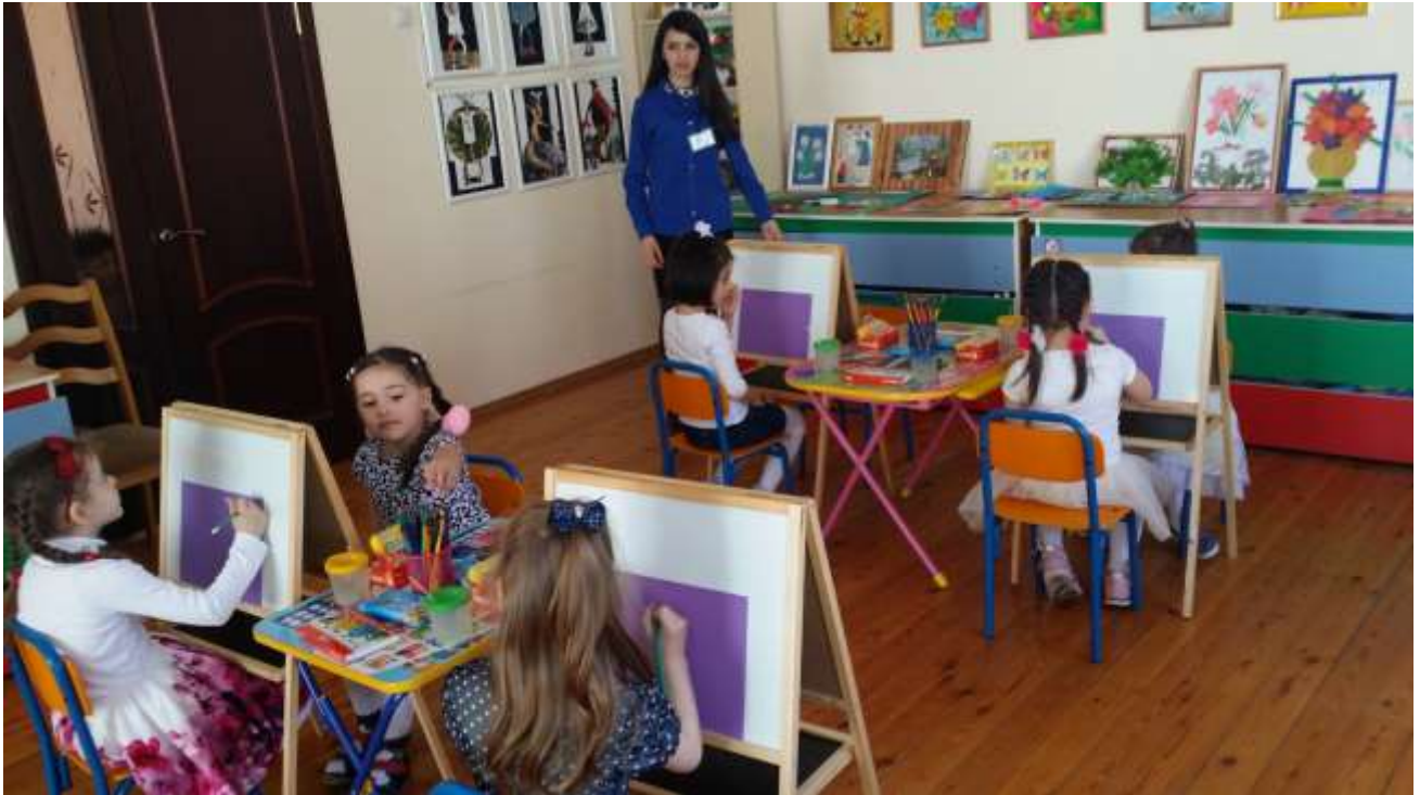
Кабинет изобразительного творчества «Вернисаж»