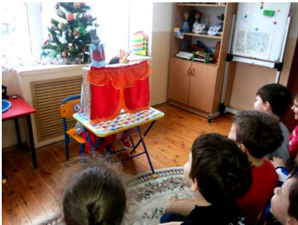
Центр музыки и театра