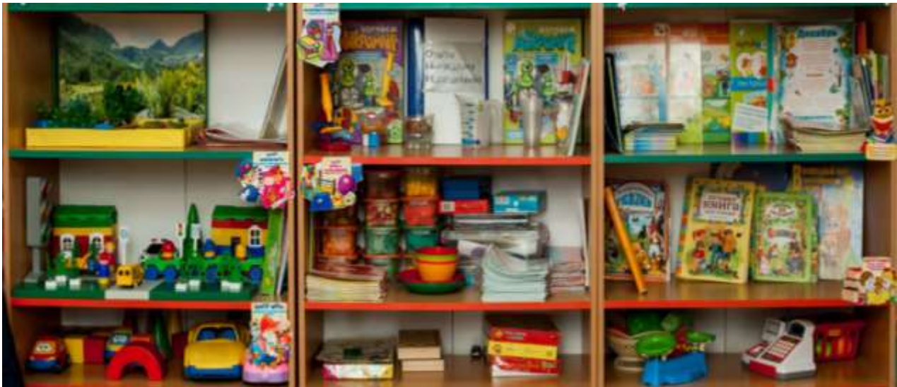
Дидактические игры на развитие психических функций – мышления, внимания, памяти, воображения