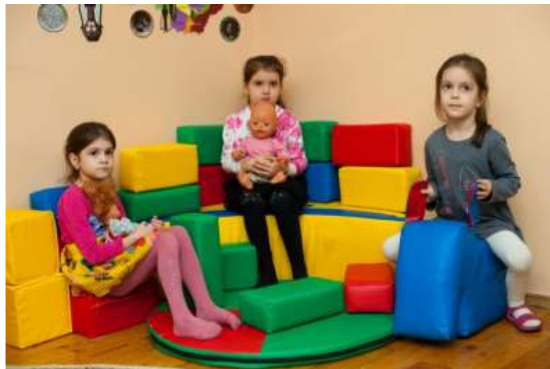
Центр сюжетно – ролевых игр