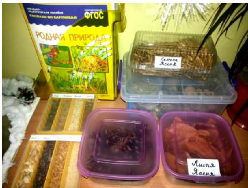
Природный материал, бросовый материал.