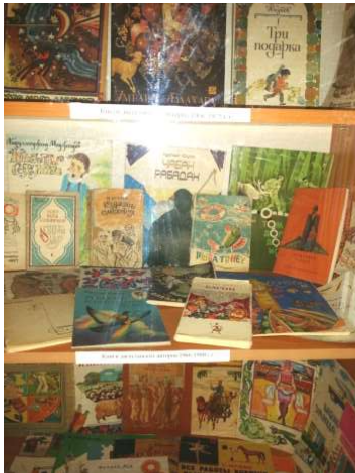
Центр музейной педагогика