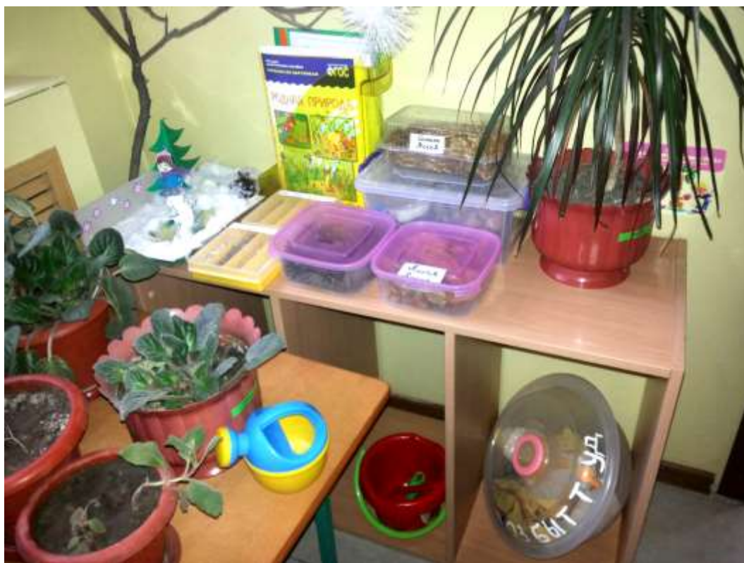
Оборудование для организации труда, ухода за растениями, уборки рабочего места