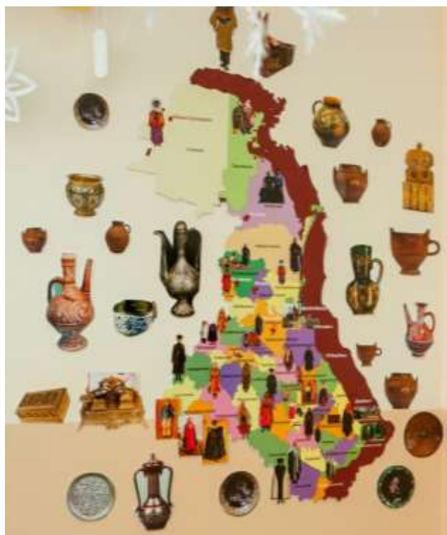
Карта народных промыслов и традиционной одежды народов Дагестана