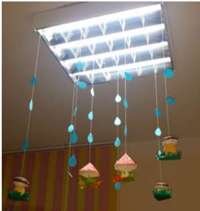
Календарь погоды, календарь природы