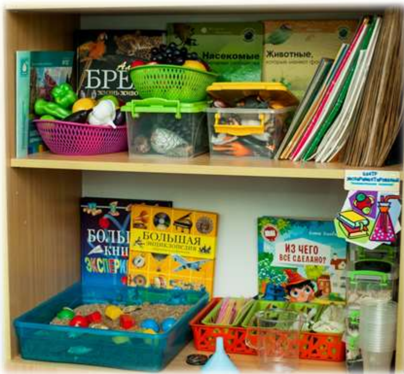
Центр развития познавательно – исследовательской деятельности