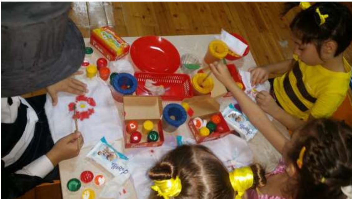
Центр изобразительного творчества