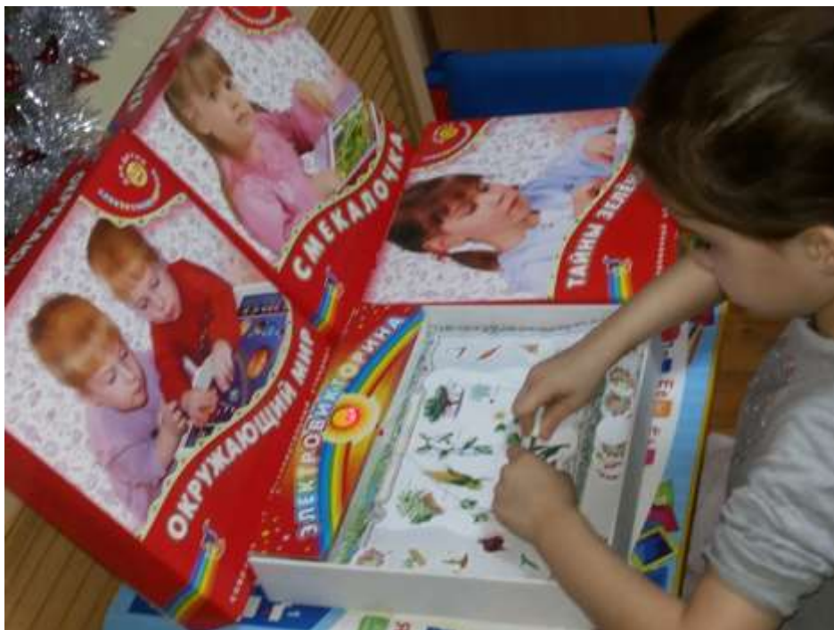
Игры нового поколения «Электровикторина»